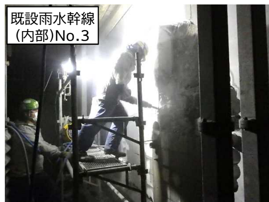
既設雨水幹線 (内部)No.3