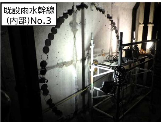
既設雨水幹線 (内部)No.3

12月は、立坑No.2～3までの推進工法によるL1-M管布設を行い、掘進機が既設雨水幹線まで到達しました。1月は、既設雨水幹線到達箇所への接合処理を行い、掘進機設備等の撤去に着手します。