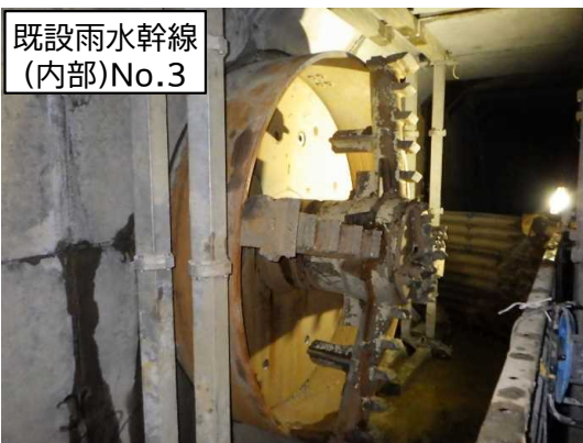
既設雨水幹線 (内部)No.3