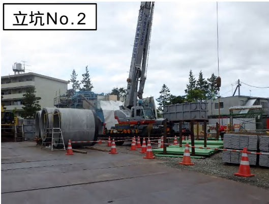
推進工法(ヒュム管布設)状況(公園内全景)