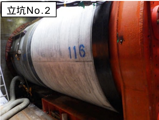
推進工法(ヒュム管布設)状況