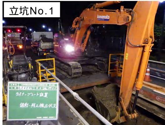
掘削(ライナープレート設置)状況