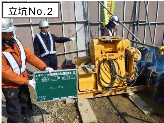
地盤改良(薬液注入)状況

3月は、立坑No.2の地盤改良(薬液注入)を行い、掘削(支保工)に着手しました。 4月は、引き続き、立坑No.2の掘削(支保工)を行います。