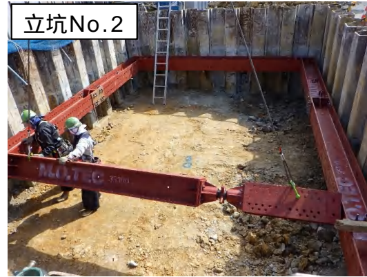
仮設土留(支保工)設置状況