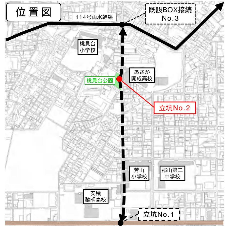
掘進機...地中を掘り進むための機械。