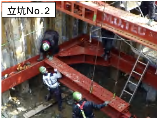
仮設土留(支保工)設置状況