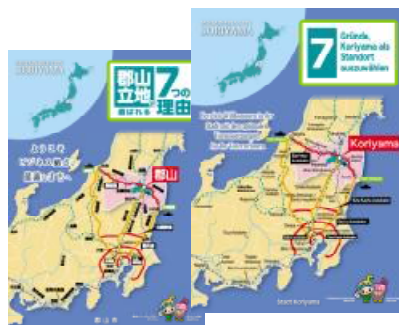
ü 企業立地をPRする新パンフレットを作成、ドイツからの企業誘致を目指し、初めてドイツ語のパンフレットを作成