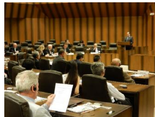
*2017年8月にエッセン市で開催された福島県とNRW州主催のセミナー

ü 福島医療機器開発支援センター (FMDDSC), 医療機器の開発、事業化を支援する国内初の施設の訪問