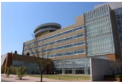
日本大学工学部 (ロハスの工学と医療工学)

ü エッセン市連携セミナー, エッセン市派遣団による郡山市内企業・研究機関等向けセミナーの開催