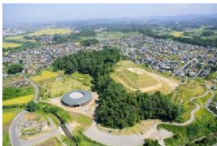
古墳時代(3世紀中頃-7世紀頃) 前期の大安場古墳