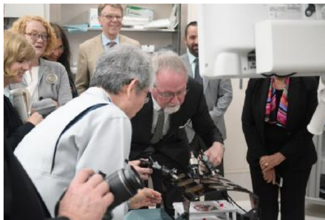
*2017年12月のエッセン市長を団長とする派遣団のFMDDSC訪問

ü 産総研 福島再生可能エネルギー研究所 (FREA), 再生可能エネルギーについての世界的な研究機関の訪問