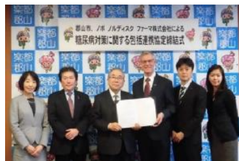
ü ノボ ノルディスク ファーマ株式会社との糖尿病対策に関するMOU、地域における糖尿病の課題解決へ連携(2018年2月)