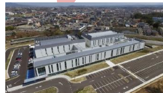
ふくしま医療機器開発支援センター (FMDDSC) 2016年11月開所