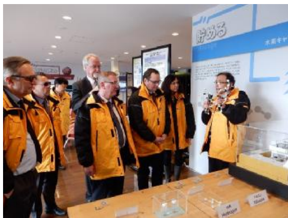
*2017年12月のエッセン市長を団長とする派遣団のFREA訪問

ü 産総研 福島再生可能エネルギー研究所 (FREA), 再生可能エネルギーについての世界的な研究機関の訪問