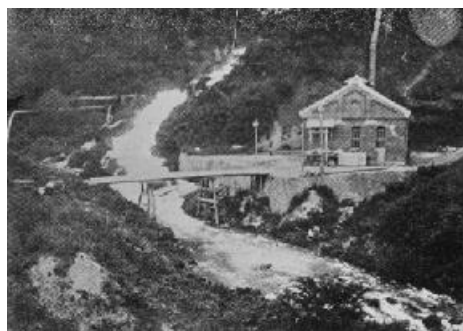
新産業発展の礎を築いた沼上発電所