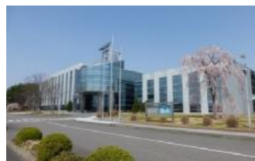
福島県ハイテクプラザ

ü 再生可能エネルギーと医療関連大学, 日本大学工学部、奥羽大学の訪問と今後の連携