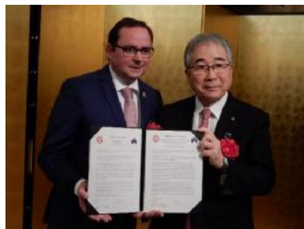
ü 2017年12月のドイツエッセン市とのMOU、再生可能エネルギーと医療機器関連産業分野