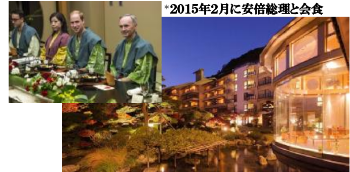
*2015年2月に安倍総理と会食

ü 東北最大級の収容人数を誇る「けんしん郡山文化センター」、大ホールの収容人数は2,004席