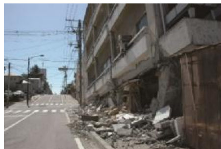
激しい地震により1階部分がつぶれたビル