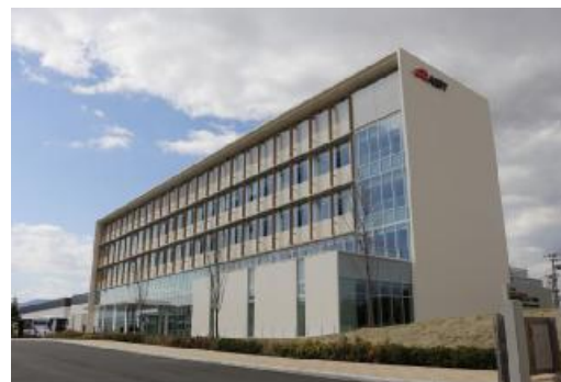
産総研 福島再生可能エネルギー研究所 (FREA) 2014年4月開所