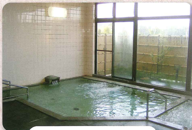
浴室 (ジェット・泡)