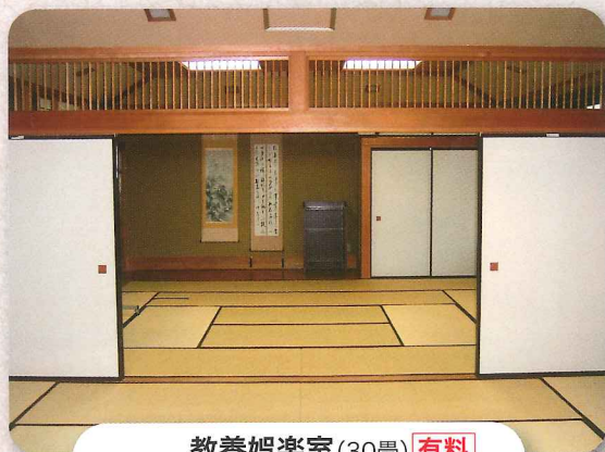
教養娯楽室 (30畳) 有料 囲碁、将棋、会議等に