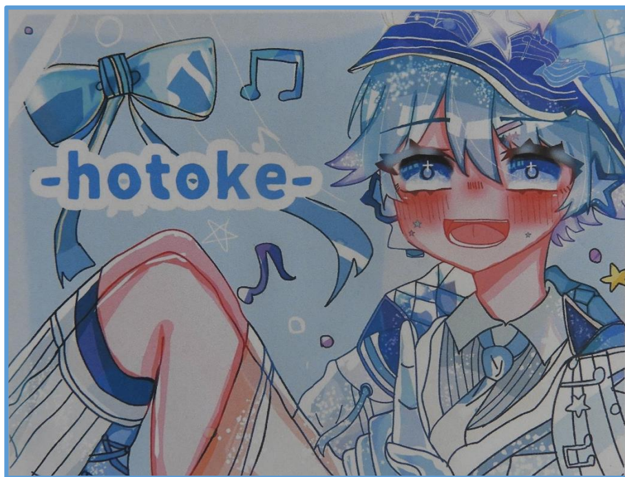
↑ 桑野地区在住・女子中学生 ↑

桑野地区の中学生・高校生からイラストや4コマ漫画の投稿がありましたので紹介します！