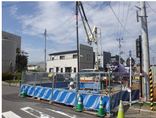
特殊人孔 コンクリート打設状況