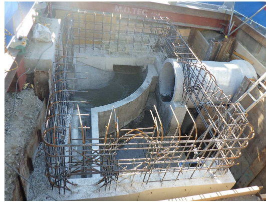
特殊人孔 仮排水管撤去完了