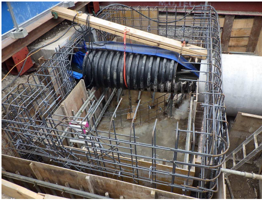
特殊人孔 鉄筋組立状況

4月は、特殊人孔の築造を行いました。 5月は、引き続き、特殊人孔の築造を行います。