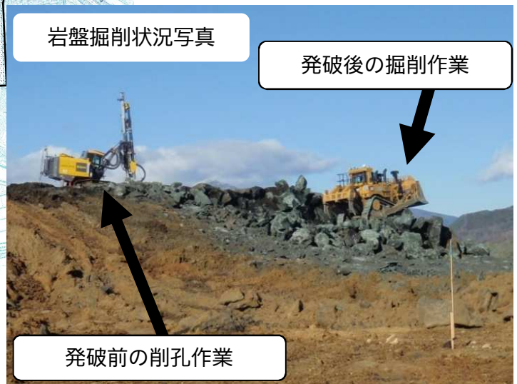
発破前の削孔作業