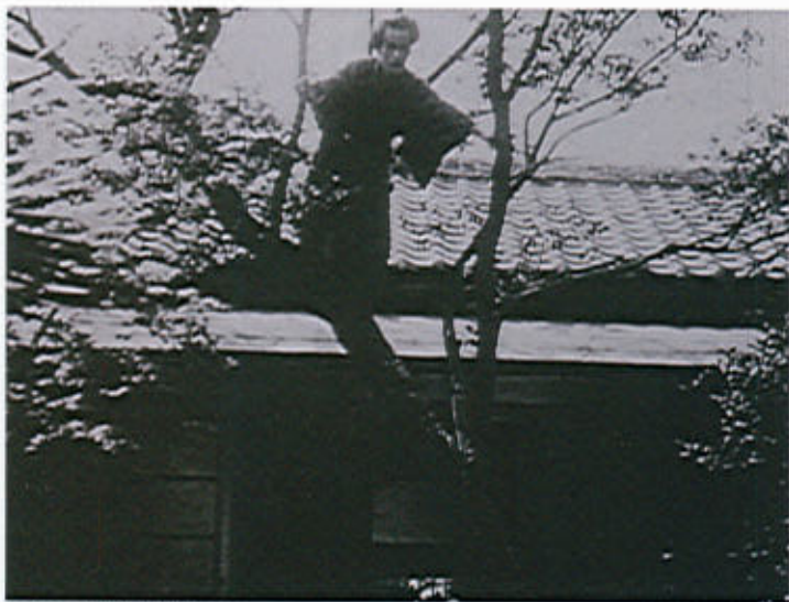
木登りをする芥川龍之介