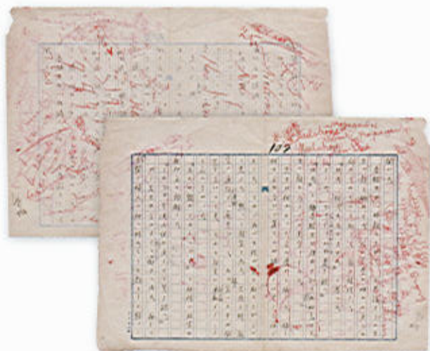
久米正雄の原稿「母」、芥川のもと思われる書き込みが多数みられる