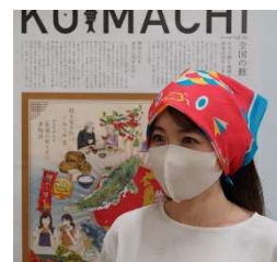
〈▲鯉バンダナ着用時〉