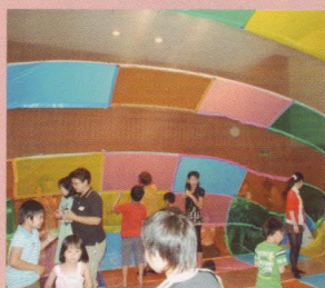
ふくらませよう！ドリームばるーん