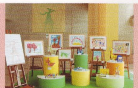
風土記の丘の美術展

黒：「べつの日には、カラフルでおっきな風船の中にみんなが入って遊んでるの見たよ！ぼくが行くと壊しそうだから遠慮したけど・・・」 白：「1日だけサーカスが来てたわね」 黒：「えっ 象とかピエロとか、空中ブランコとか？」 白：「ちやいまんがな。アートサーカスですよん。アート作品をぎょうさん積んだトラックが来ましたやろ。ふわふわの人形とか、ロビーまで占拠しましたやんか。みんなカラーブロックで彫刻作ったりしてましたで。」 黒：「あゝ、そうだったっけ。テレビ出演で燃え尽きて寝たのかな？」 白：「・・・。でもさあ、やっぱり子供たちの笑顔っていいわよね(うっとり)」 黒：「いいよね。のびのびとものづくりを楽しんだり、ゆっくり絵を見たり・・・そうやーその調子やー子供たち！美術館を、人生を楽しむんや！親御さんもグツグツジョブやで！みんなの笑顔のためやったら、わてら命はりますよってに・・・ZZZ・・・(燃え尽きる)」 白：「ふふ、おやすみ。私たちの展覧会も、たくさん人が来てくれたしね。これからも、美術館をよろしく！」