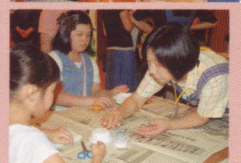
つくろう！あそぼう！夏まつり☆