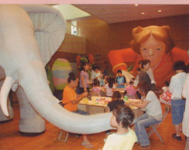
デイリリーアートサーカス

黒：「べつの日には、カラフルでおっきな風船の中にみんなが入って遊んでるの見たよ！ぼくが行くと壊しそうだから遠慮したけど・・・」 白：「1日だけサーカスが来てたわね」 黒：「えっ 象とかピエロとか、空中ブランコとか？」 白：「ちやいまんがな。アートサーカスですよん。アート作品をぎょうさん積んだトラックが来ましたやろ。ふわふわの人形とか、ロビーまで占拠しましたやんか。みんなカラーブロックで彫刻作ったりしてましたで。」 黒：「あゝ、そうだったっけ。テレビ出演で燃え尽きて寝たのかな？」 白：「・・・。でもさあ、やっぱり子供たちの笑顔っていいわよね(うっとり)」 黒：「いいよね。のびのびとものづくりを楽しんだり、ゆっくり絵を見たり・・・そうやーその調子やー子供たち！美術館を、人生を楽しむんや！親御さんもグツグツジョブやで！みんなの笑顔のためやったら、わてら命はりますよってに・・・ZZZ・・・(燃え尽きる)」 白：「ふふ、おやすみ。私たちの展覧会も、たくさん人が来てくれたしね。これからも、美術館をよろしく！」