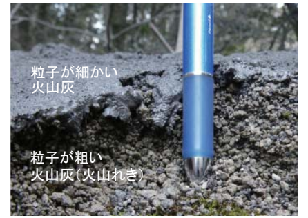
粒子が細かい火山灰 粒子が粗い火山灰(火山れき) (新燃岳(霧島山), 2011年) 火山灰が積もった斜面の断面 粒子が細かい火山灰によって、地表面が覆われています。

1991年(平成3年)の雲仙普賢岳、2000年(平成12年)の有珠山や三宅島の噴火でも降灰後の降雨による土石流で多くの被害が発生しました。