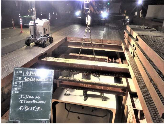
ボックスカルバート布設状況

3月は、ボックスカルバート布設などを行いました。 4月は、覆工板撤去・側溝再設置などを行います。