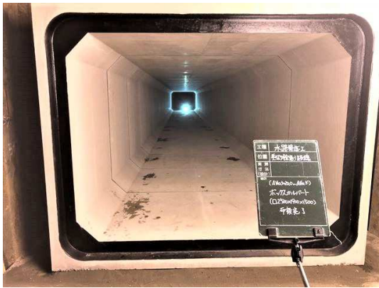
ボックスカルバート布設完了