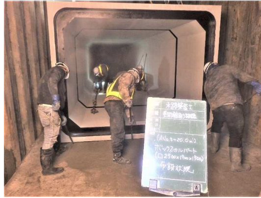
ボックスカルバート布設状況