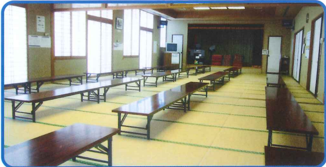
大広間(72畳) 有料 休憩所、おくつろぎに