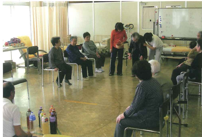
体操・レクリエーション