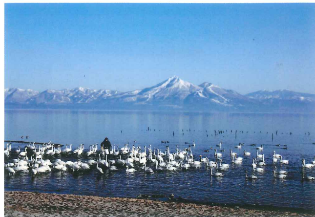
猪苗代湖 夏は湖水浴や釣り、冬は白鳥の飛来地