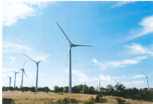
郡山布引「風の高原」