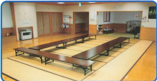
健康増進室 有料 会議、レクリエーション等に