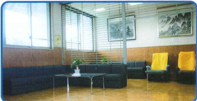
2階ホール 無料 休憩、おくつろぎに