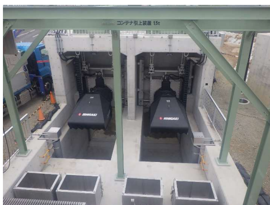
ポンプゲート動作完了