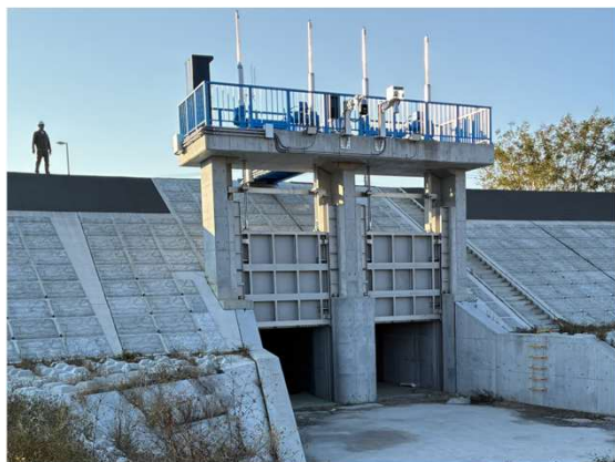
排水樋門動作確認

11月は、各種動作試験などを行い、石塚樋門・ポンプゲート築造工事（第2工区）が完了しました。本工事へのご理解とご協力ありがとうございました。