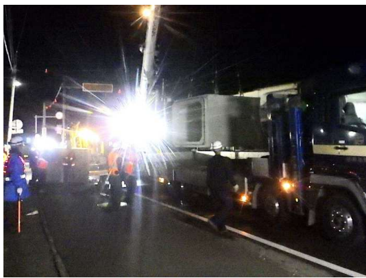
ボックスカルバート布設状況