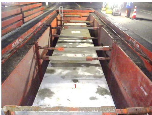
ボックスカルバート布設完了