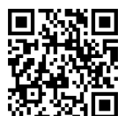
郡山市国際交流協会 Facebook

当協会Facebookに、イベントや講座をやさいい日本語で作成したちらしを掲載しています。また、県内、県外の国際交流団体や関係団体のイベント・講座情報を随時更新します。ぜひご覧ください！