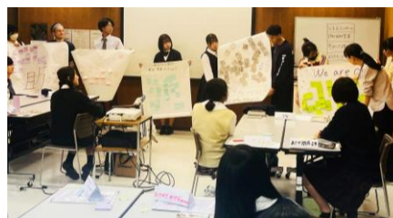
↑皆で案を出しあった作成の様子