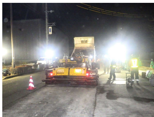
既設雨水管撤去 舗装仮復旧状況