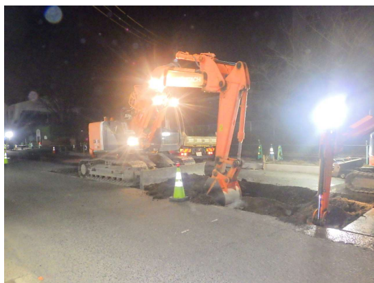
既設雨水管撤去 掘削状況