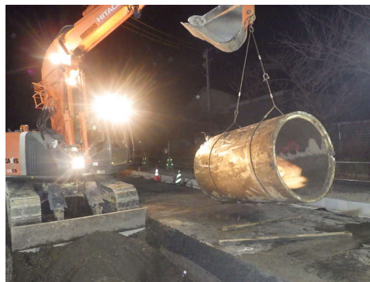
既設雨水管撤去状況