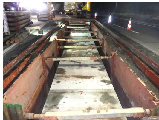
ボックスカルバート布設完了