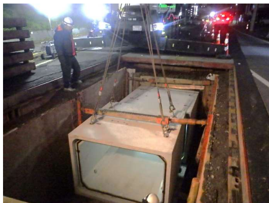
ボックスカルバート布設状況

12月は、掘削、土留工及びボックスカルバート布設を行いました。 1月は、引き続き、掘削、土留工及びボックスカルバート布設を行います。