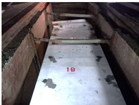
ボックスカルバート布設完了