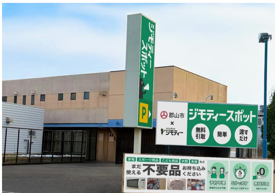
ジモティースポット郡山希望ヶ丘店 外観写真