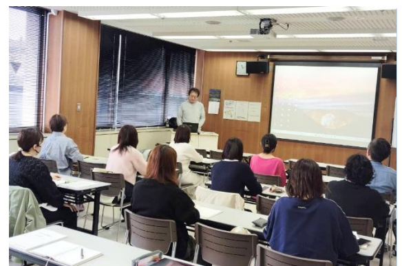
▲保護者勉強会で知識を深めます