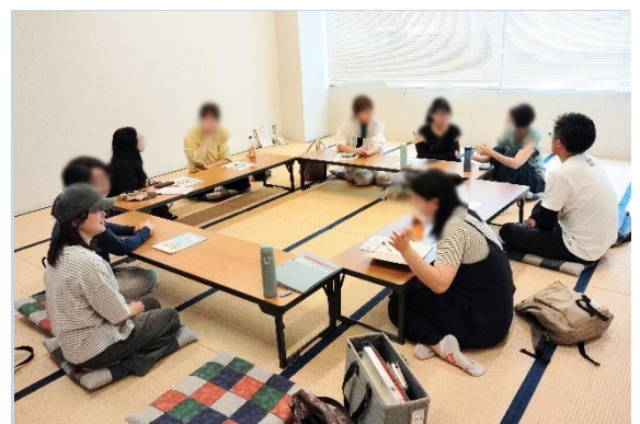
▲保護者のつながりづくりの場である茶話会

勉強会では、正確で役立つ知識を得られるだけでなく、家族同士がつながる場ともなっており、ネットワークづくりにも役立っています。