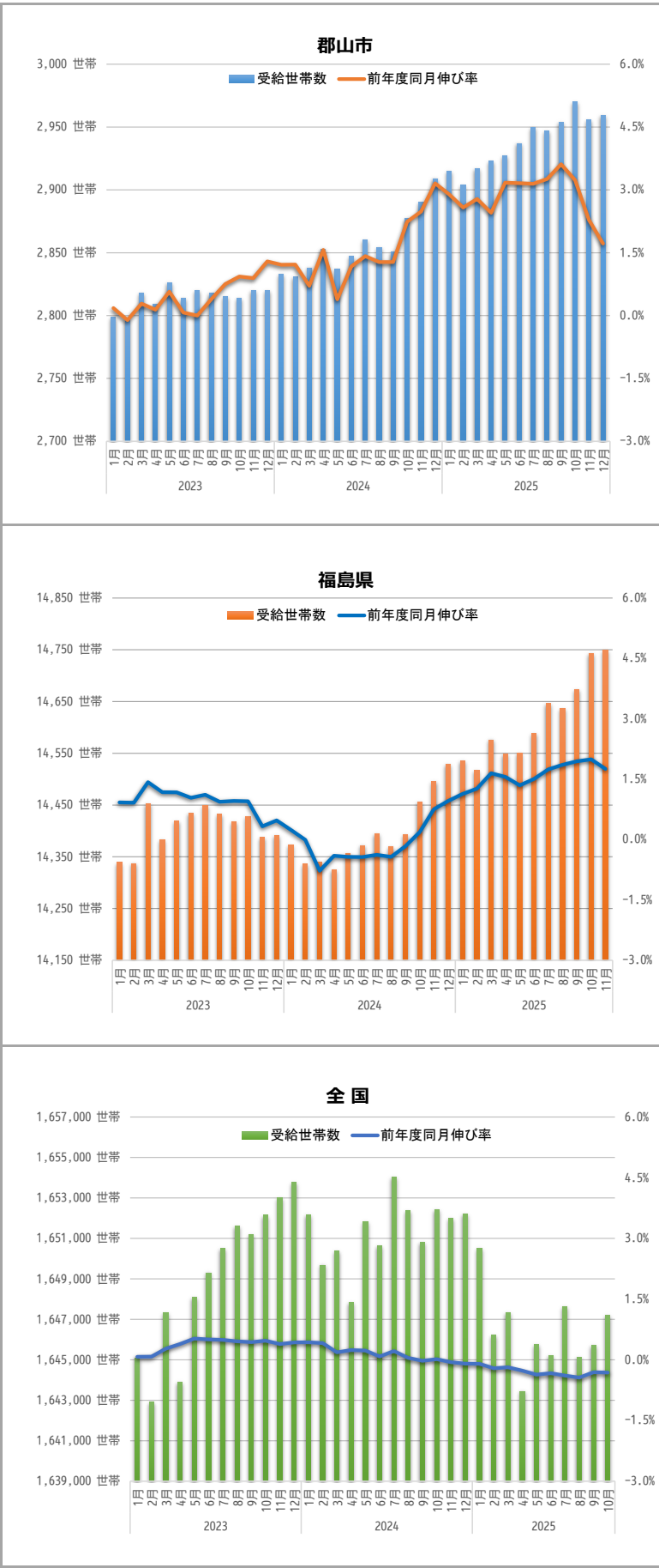
被保護受給世帯数と対前年同月伸び率