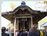
東光寺 の中地 大仏