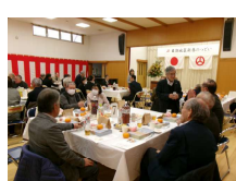
歓談中各テーブル