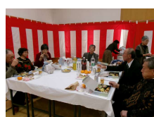
歓談中各テーブル