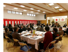
会場全景: 東側後方から