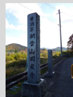
洞泉寺 の日本 一観音

●東部令明人講座：6月26日～12月11日まで7回の講座で、館外バス学習では喜多方市をまわりました。