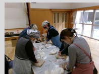
発酵食品の知 識を深めての 味噌づくり

●スマホ講座：10月30日～12月16日まで4回の初心者向け基礎で、スマホの特徴や基本操作の講座です。