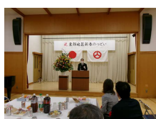
東部地区町内会連合会長挨拶