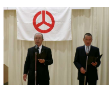
祝吟: 東芳吟詠会様