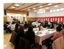
会場全景: 西側後方から