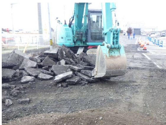
舗装版取壊し状況