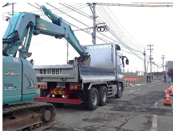
舗装版取壊し状況