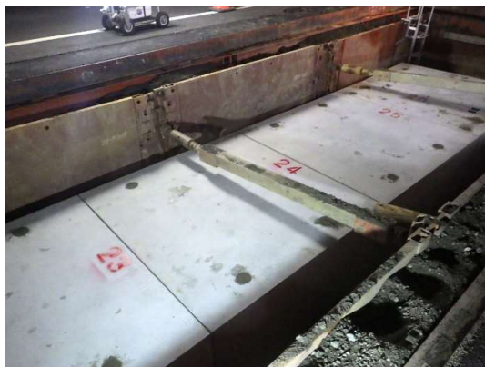
ボックスカルバート布設完了