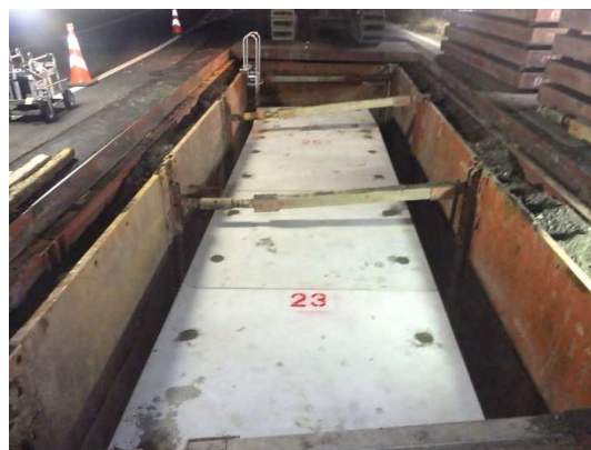
ボックスカルバート布設完了