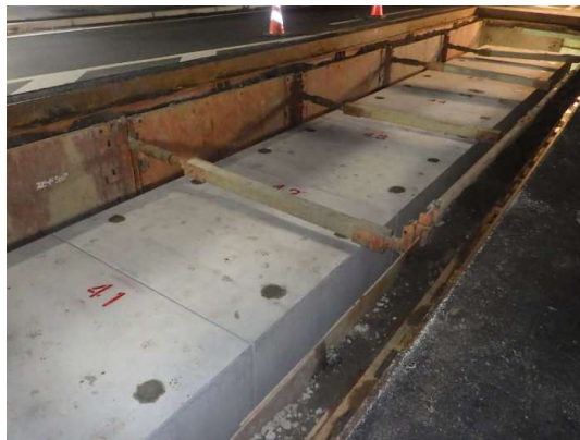
ボックスカルバート布設完了