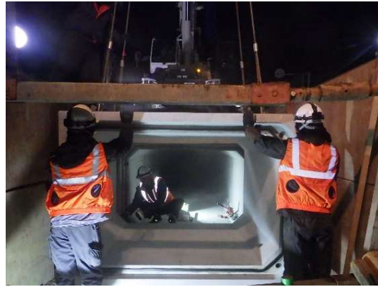
ボックスカルバート布設状況