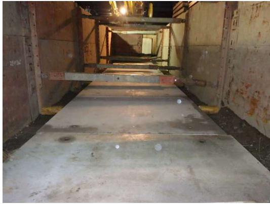
コンクリート基礎板設置状況

2月は、掘削、土留工及びボックスカルバート布設を行いました。 3月は、後片付けなどを行います。