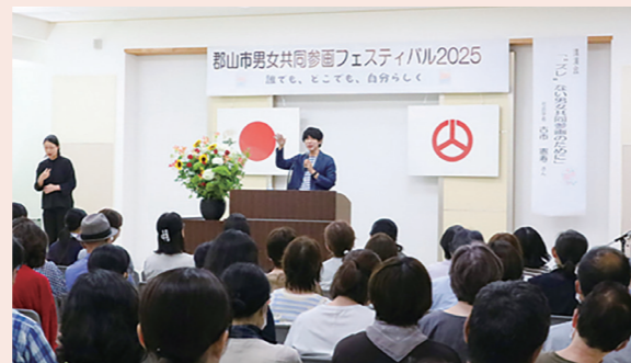
古市憲寿氏講演 「“ズレ”ない男女共同参画のために」