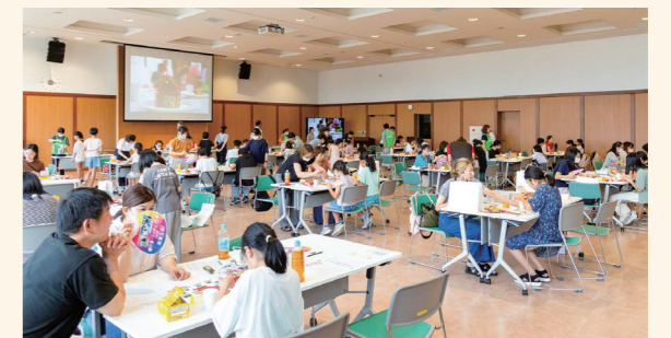
理工系女子支援事業 「お菓子の家づくりをととして、建築士の仕事を体験しよう」