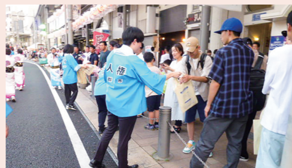
人権啓発活動 (郡山うねめまつり)