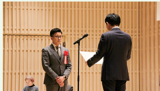
「男女共同参画推進事業者表彰」表彰式