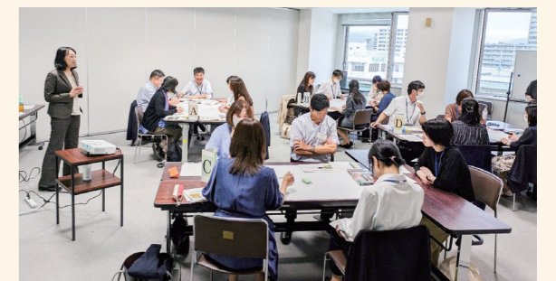
こおりやま女性の活躍推進ネットワーク会議 グループワーク(女子学生が選びたい会社グランプリ)