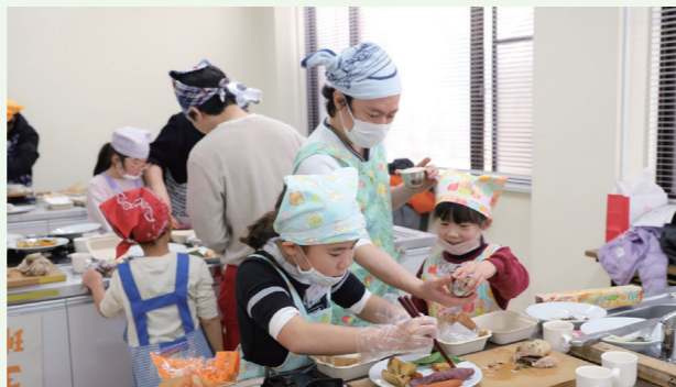
男性の家事・応援事業 「父と子のふれあい教室」