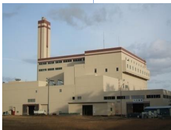
こう ず 河内クリーンセンター