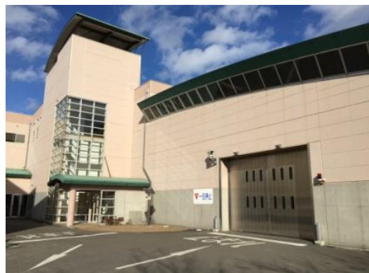
リサイクルプラザ