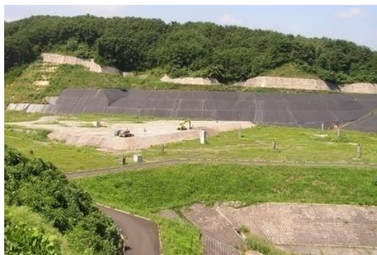
こう ず うめ たて しよ ぶん じょう 河内埋立処分場