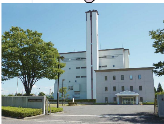
ふ く やま 富久山クリーンセンター