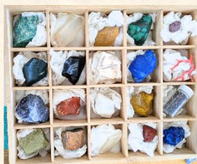
岩絵具の原料となる岩石

岩の種類、粒のサイズ、塗り重ねる回数などで全く異なる色味となるため、豊かな色彩となります。洋画とは異なるマットな質感もお楽しみください。