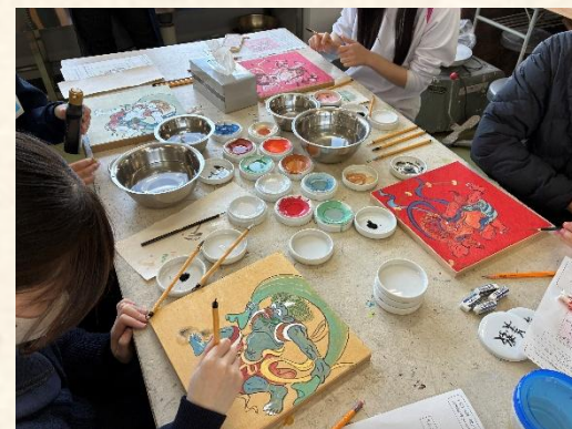
着彩している様子