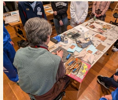
昨年度に実施した「銅版画制作ワークショップの様子」

受講生の制作したオリジナルの風神・雷神図を展示しますので、ゆっくりとご覧ください。