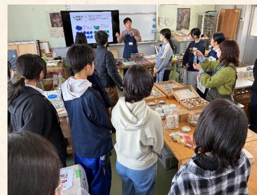
講義を受講する様子