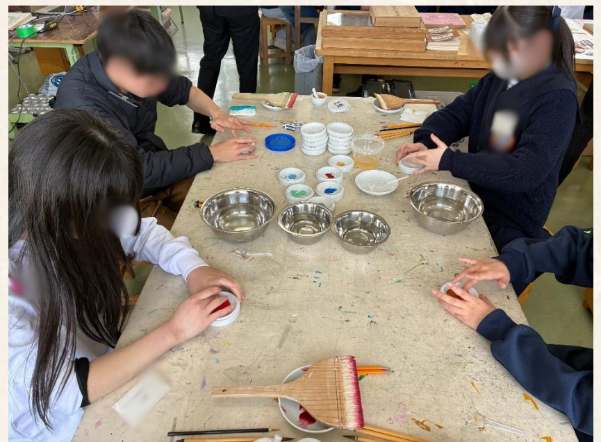
岩絵具と膠を混ぜている様子