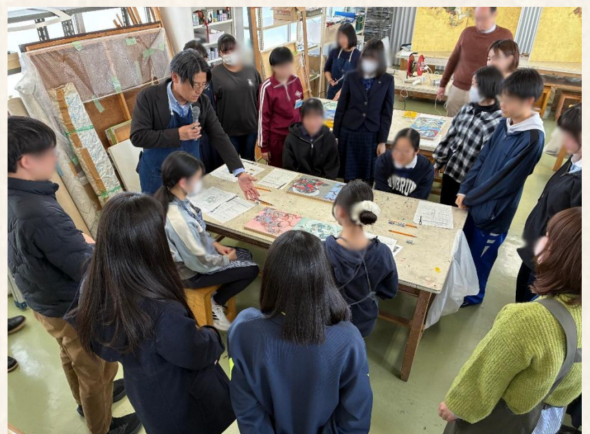
作品鑑賞・振り返り