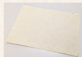
海老根伝統手漉和紙

今回のワークショップでは、講師の先生方が実際に手漉きして作った和紙を使用しています。