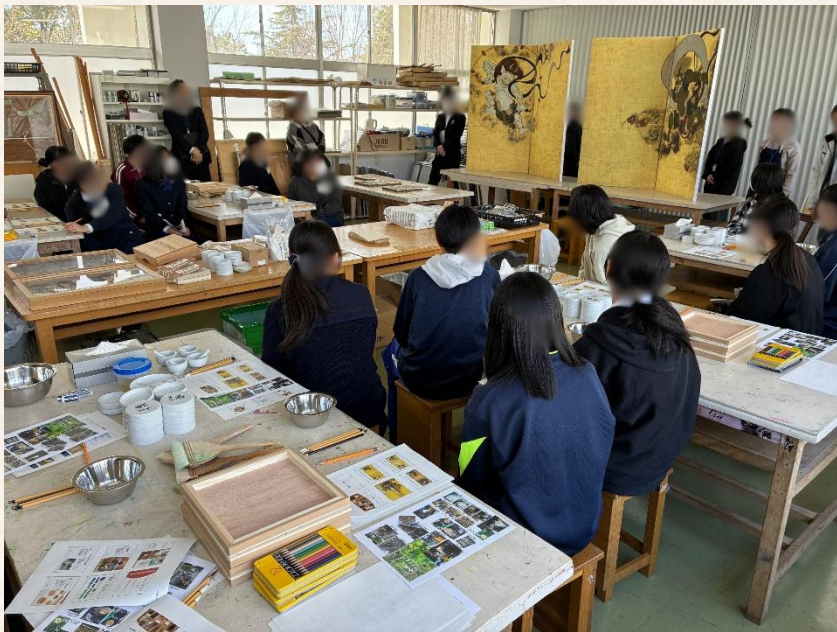
原寸大の風神・雷神図を眺める様子