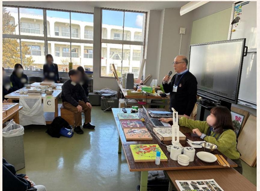
海老根和紙についての説明