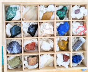
岩絵具の原料となる岩石

岩の種類、粒のサイズ、塗り重ねる回数などで全く異なる色味となるため、豊かな色彩となります。洋画とは異なるマットな質感もお楽しみください。