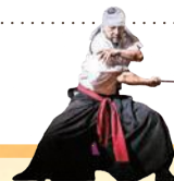
サムライアーティスト 剣伎衆かむゐ