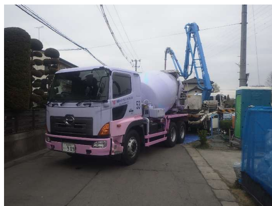
基礎コンクリート打設状況