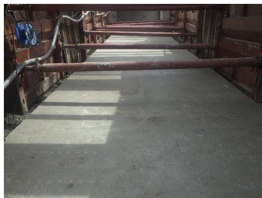
基礎コンクリート打設完了