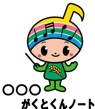
名称を用いた商品表記