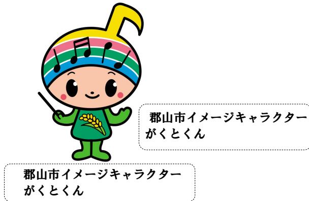
二段書きによる名称表記