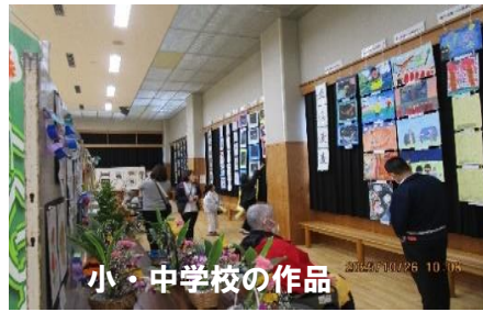
小・中学校の作品