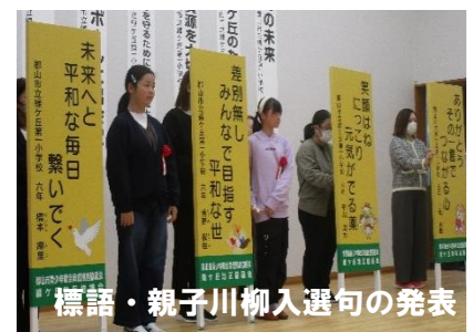
標語・親子川柳入選句の発表