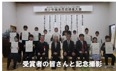
受賞者の皆さんと記念撮影