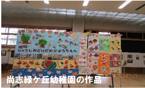
尚志緑ヶ丘幼稚園の作品