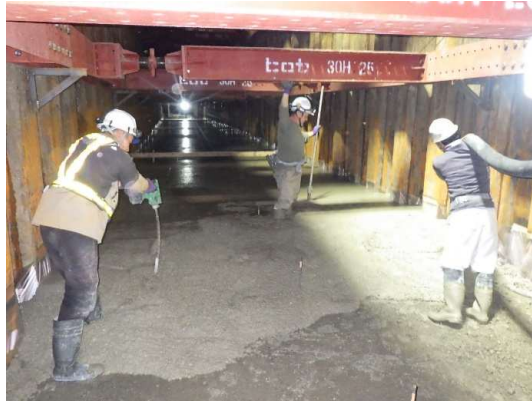
基礎コンクリート打設状況