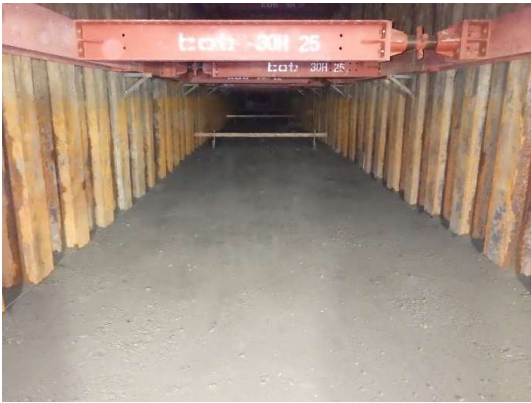
基礎砕石施工完了

4月は、基礎砕石、基礎コンクリート打設などを行いました。 5月は、ボックスカルバート布設などを行います。