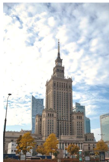
↑文化科学宮殿（首都ワルシャワ）

※お車で越しの際は駐車場の無料処理を行いますので、会場に駐車券をお持ちください。