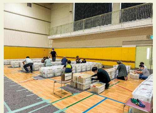
▲丁寧なチェックで仕事の質を高めます