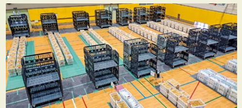
▲郡山郵便局と協力した圧巻の納品作業