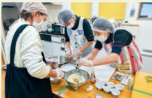
専門技術講師派遣

障害福祉サービス事業所等で作られている手作り製品や自主生産品、下請け作業に代表される受託事業などの“授産事業”を、より多くの皆様に広めるための活動をしています。