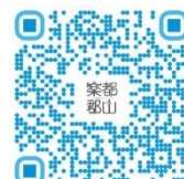
▲ホールコンサート ウェブサイト

https://www.city.koriyama.lg.jp/site/gakutokoriyama/20393.html