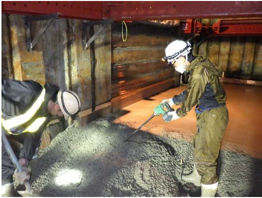
基礎コンクリート打設状況

5月は、ボックスカルバート布設などを行いました。 6月は、引き続き、ボックスカルバート布設などを行います。