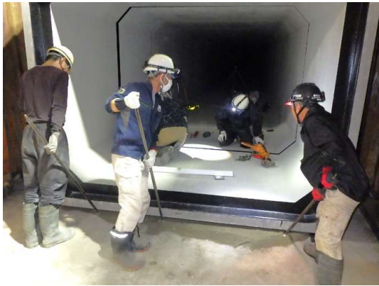
ボックスカルバート布設状況