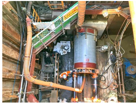
推進状況(発進立坑の上から見た管渠)