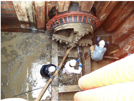
到達立坑内部 (上から見た状況)