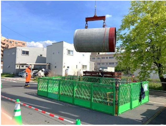
推進工状況 (発進立坑 管下ろし)

5月は、推進工などを行いました。 6月は、到達立坑箇所です特殊人孔設置などを行います。