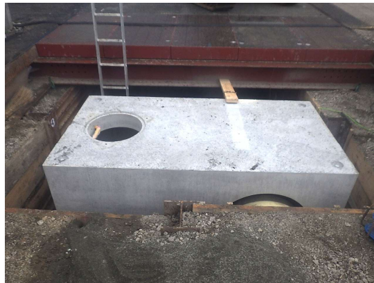
特殊人孔設置状況