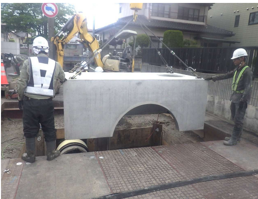
特殊人孔設置状況