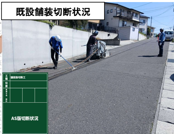
既設舗装切断状況