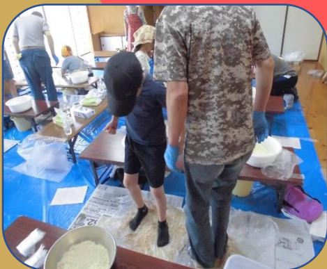
大豆が熱いうちに踏むぞ！