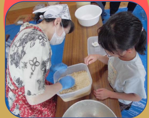
ぎゅうぎゅう詰めて空気をなくそうね

大人と子どもがペアーになり、豆を踏んで潰し、クリーム状になるまで頑張りました。大豆のいい香りに包まれながら、おいしくなあれと気持ちを込めて作りました！食べ頃は、9月です！待ち遠しい～！