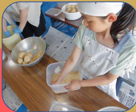
大豆、麴だんごは空気を入れないように！