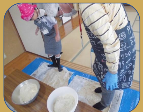
クリーム状になるまで踏む