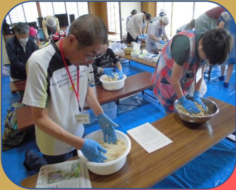
麺はパラパラにしましょう！