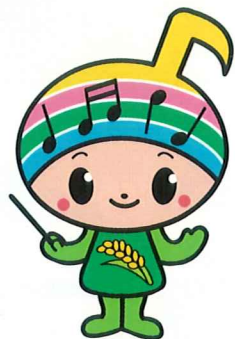
郡山市イメージキャラクター 「がくとくん」