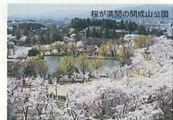
桜が満開の開成山公園

全国から集った入植者や技術者、政府、そして安積の地に生きた人々が、ともに切り拓いた安積開拓。かつて、福島県と開成社が開拓を進めていた折、灌漑用の沼の堤に、約3,900本の桜を植えた。現在でも、開拓の歴史を見守ってきたソメイヨシノの老木は、春になると開成山公園の土手一帯を覆い尽くす。