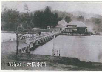
当時の十六橋水門

で初めて疏水の設計に導入したことである。当時最先端の機器が用いられ、実測データに基づき科学的に検討するという従来の経験主義を脱却した草分け的な設計であった。この検証により、安積原野へ水を流しても、西側へ流れる水量は減らないことが実証され、水利という長年の大きな課題を解決に導いた。また、猪苗代湖の氾濫に苦しんでいた湖岸の住人達は、十六橋水門が治水の役割も持つことを知り、遠く離れた地からボランティアとしてこの