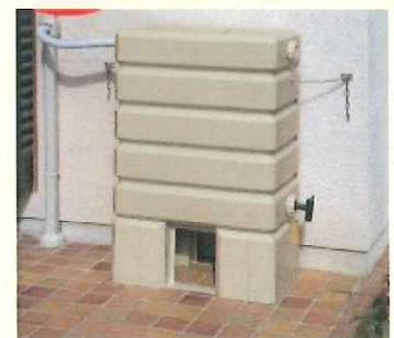
雨水貯留タンク（設置例）