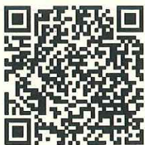
ウェブページ QRコード

補助対象になるか分からない場合など詳しくは お客様サービス課(932-7666) までお問合せ下さい。 ※購入前にご相談下さい。