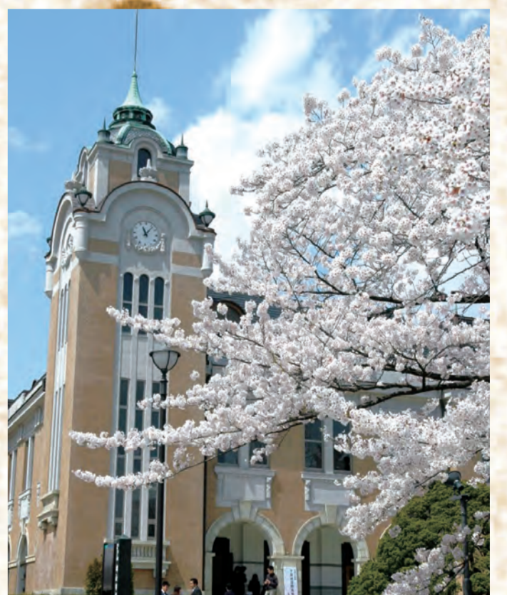
5 郡山市公会堂のさくら