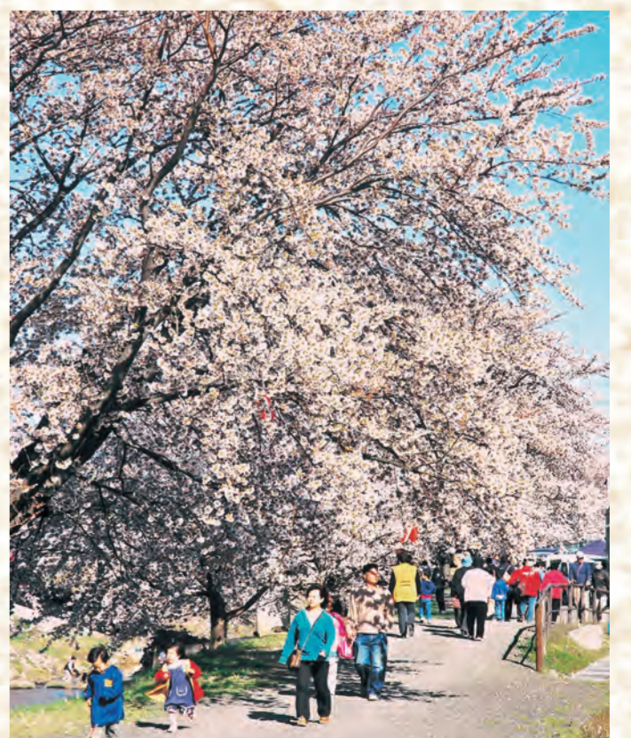
10 藤田川ふれあい桜