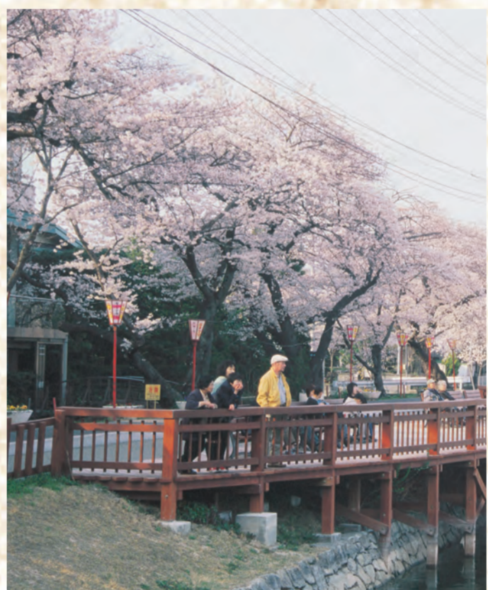
4 五百淵公園のさくら