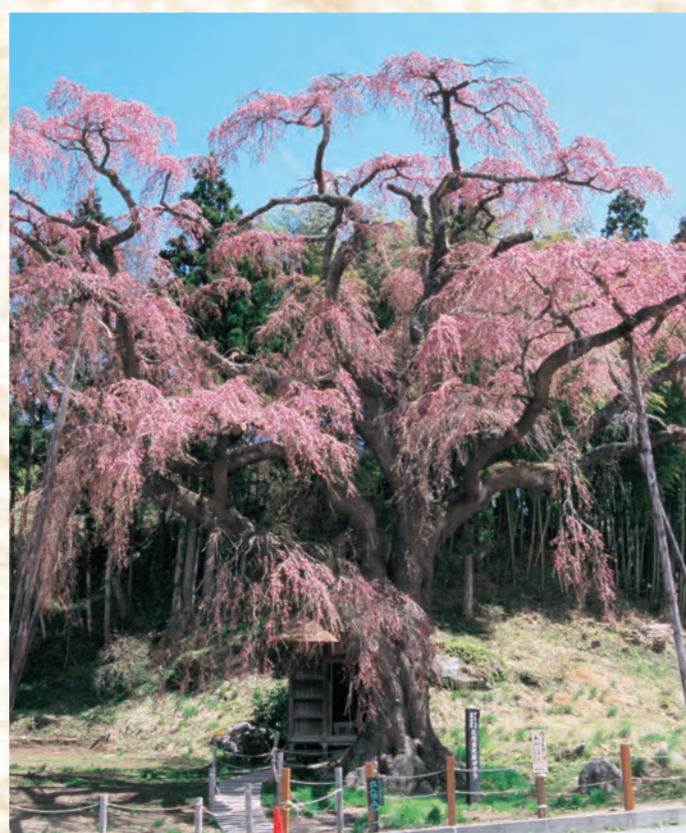
2 紅枝垂地蔵ザクラ