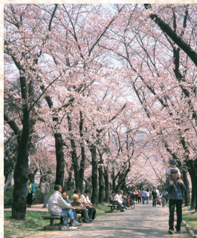
1 開成山公園のさくら

桜に対する北国の人々の気持ちは特別です。厳しい寒さに耐え、可憐にそして、豪快に花開くその姿が、自分たちの生活と重なって見えるからなのではないでしょうか？今回ご紹介するのは、地元の皆さんに愛されている心の桜の一部です。ぜひ、郡山の風土と気候に根付いた美しい花に直接足をお運びいただき、心に新しい1ページを加えていただきたいと思います。