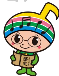
郡山市イメージキャラクター がくとくん