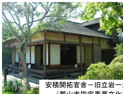
安積開拓官舎-旧立岩一郎邸- (郡山市指定重要文化財)