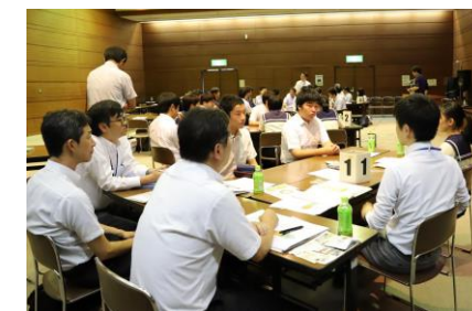
【令和元年度意見交換会の様子】