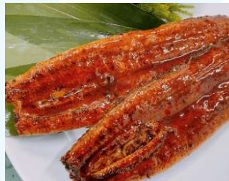
写真はうなぎA(5,000円)のイメージ写真です

⑫ 土用丑の日! うなぎA 5,000円(税込) 国産(愛知・静岡) うなぎ長焼き 特大サイズ 200g 2尾