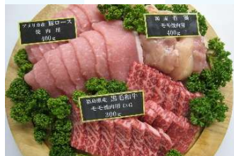
写真は和牛焼肉セット(5,000円)のイメージ写真です

⑰ 牛肉3点セット 6,000円(税込) 福島県産和牛カルビ400g アメリカ産牛バラ300g アメリカ産牛タンスライス260g