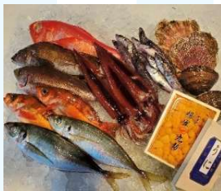
写真は養沢セット(15,000円)のイメージ写真です

④ 熟成魚セット 5,000円(税込) 特殊な技法で活けた魚を数日間熟成させた通常入手困難な商品です。 養殖 真鯛・シマアジ・ヒラメ 身卸し半身パック